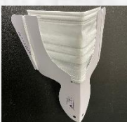
手持ちマスクをご用意いたします。（無料）