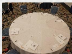
飛沫感染防止用のアクリルパネルをご用意しております。（無料）