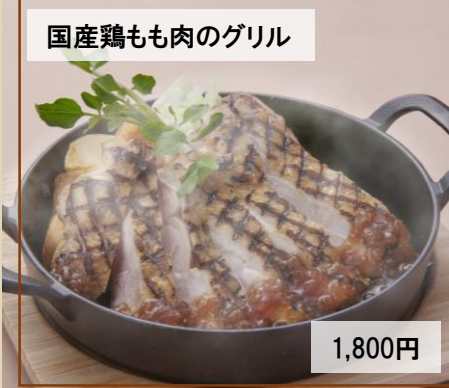
国産鶏もも肉のグリル