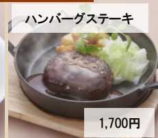
ハンバーグステーキ