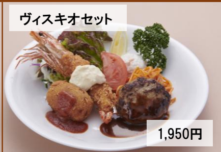
ウイスキーオセット