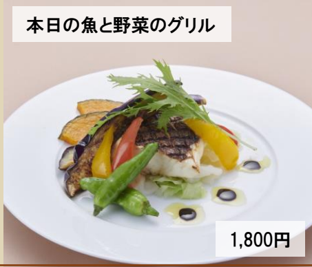
本日の魚と野菜のグリル