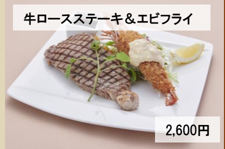
牛ロースステーキ&エビフライ