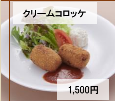
クリームコロッケ