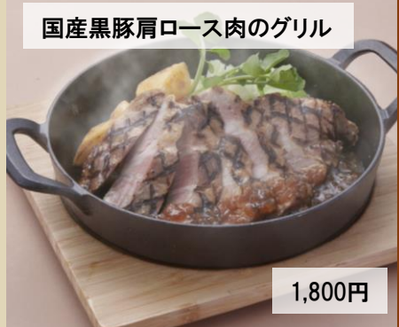
国産黒豚肩ロース肉のグリル