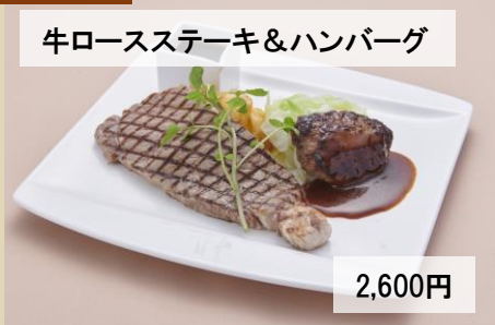
牛ロースステーキ&ハンバーグ