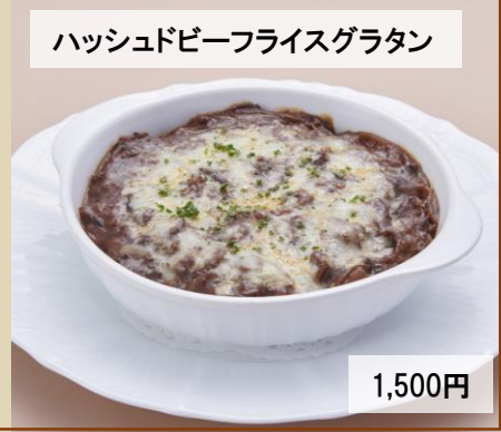
ハッシュドビーフライスグラタン