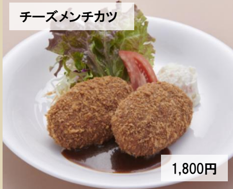
チーズメンチカツ