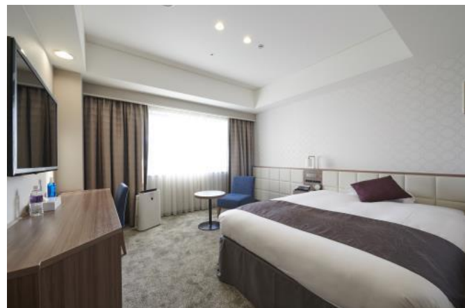
【モデレートシングル 20㎡】