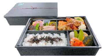
おもてなし弁当 3,000円(消費税込)

会議やセミナー後にお持ち帰りいただけます。 ※7日前までにご予約ください ※5個より承ります