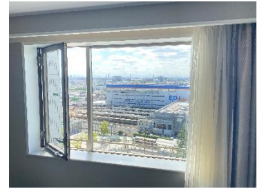
客室は窓の開閉が可能です。