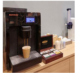
1階 ゲストラウンジ(宿泊者専用)

1階 ゲストラウンジ(宿泊者専用)に無料のコーヒー・紅茶をご用意しております。(客室にお持ちいただけます)